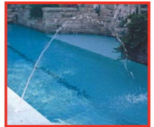
Chorro simple de 5/16"