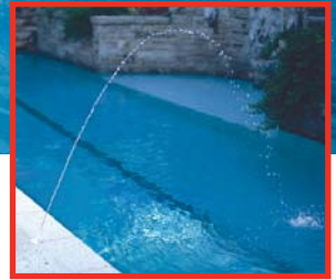
Chorro simple de 1/4"