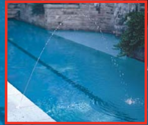
Chorro simple de 3/16"