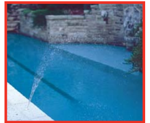
Rociador en abanico

Los primeros juegos de agua fueron diseñados para uso comercial y, luego, se adaptaron para uso residencial. Esto dio como resultado la sobreingeniería del producto y precios elevados. El chorro para efectos de agua para plataforma de Pentair Water está especialmente diseñado para uso residencial, y utiliza materiales de construcción y técnicas de fabricación que permiten tener costos reducidos. La construcción de las partes clave hecha totalmente en plástico reduce los costos iniciales y de vida útil del sistema, y al mismo tiempo ofrece una operación sin problemas con mínimo mantenimiento o sin necesidad de mantenimiento.